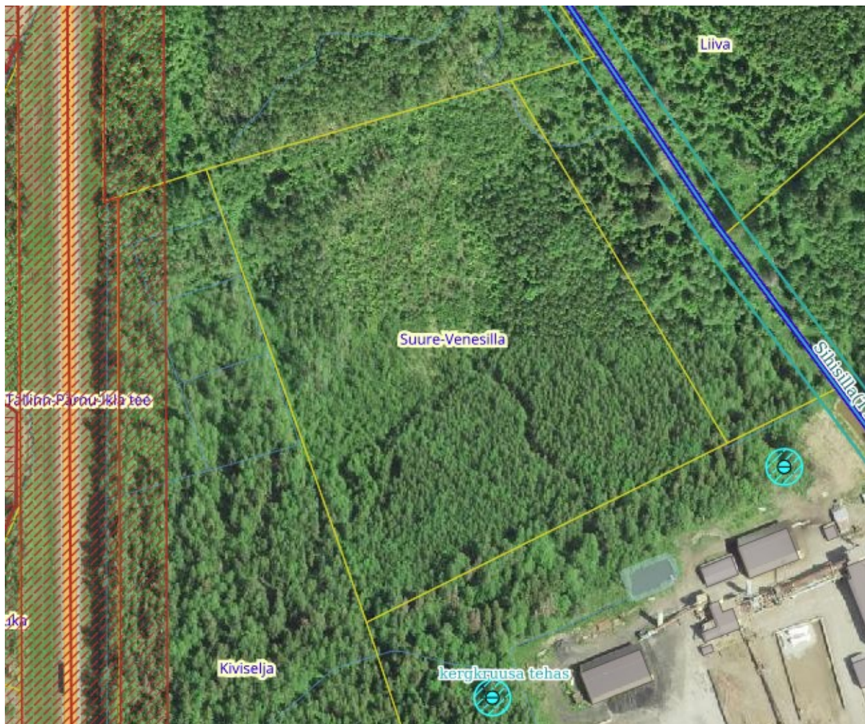
Joonis 2. Maa-ameti kitsenduste kaardi väljavõte

Suure-Venesilla kinnistul kitsendused puuduvad.